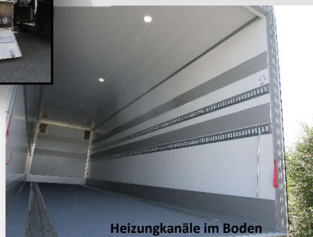
Heizungskanäle im Boden