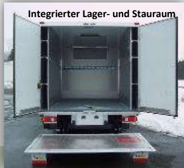
Integrierter Lager- und Stauraum