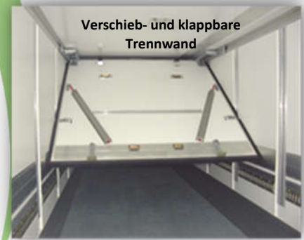
Verschieb- und klappbare Trennwand