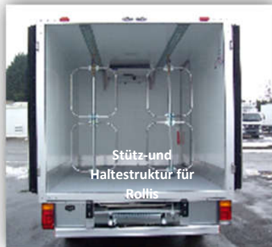
Stütz- und Haltestruktur für Rollis