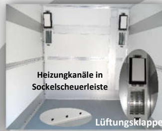
Heizungskanäle in Sockelscheuerleiste